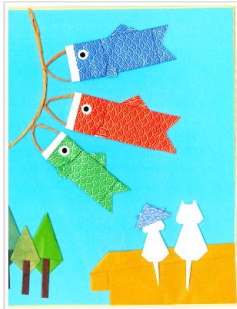
■折り紙クラブの作品です