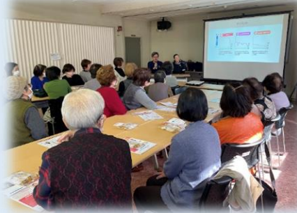
人生会議について 学びました

高齢者が集まれる場として月1回開催しています。講師を招いたり小学校の子どもたちと交流したりもしています。