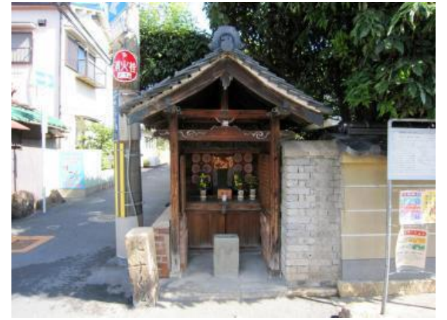
【旧街道道しるべ・おつる地蔵】

福祉委員会の諸行事も地域各部会との合同で連携した行事が多く、中学校の通学路の清掃を始め、公民分館の文化祭、子供育成会祭りや防災訓練・健康吹き矢大会、各町会の餅つき大会等々世代間交流も兼ねて地域全体で仲良く楽しく活発に