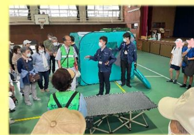
テント・ベッドの組み立て