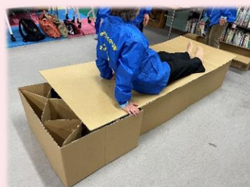
段ボールベッド体験