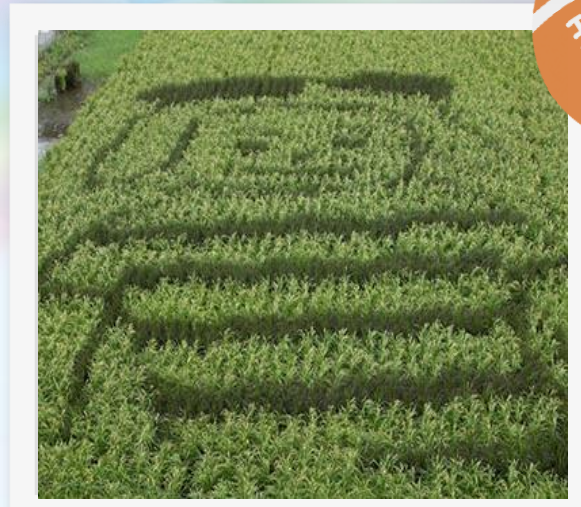
東大阪初の田んぼアート!

英田南校区は、大阪府東部の生駒山のふもとに位置し、東大阪市のランドマーク花園ラグビー場を中心に、市民の憩いの場である花園中央公園をはじめ、多目的球技広場、ドリーム21（児童文化スポーツセンター）、市立美術センターや花園中央図書館などが整備されており、スポーツ・文化・芸術の発信基地をして、ふれあい豊かなまちづくりをめざしています。