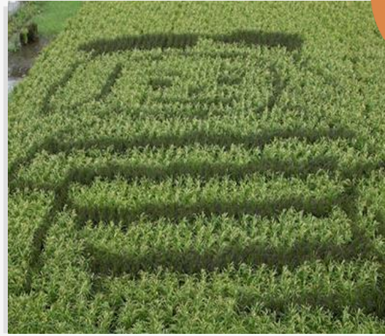
東大阪初の田んぼアート!

英田南校区は、大阪府東部の生駒山のふもとに位置し、東大阪市のランドマーク花園ラグビー場を中心に、市民の憩いの場である花園中央公園をはじめ、多目的球技広場、ドリーム21（児童文化スポーツセンター）、市立美術センターや花園中央図書館などが整備されており、スポーツ・文化・芸術の発信基地をして、ふれあい豊かなまちづくりをめざしています。