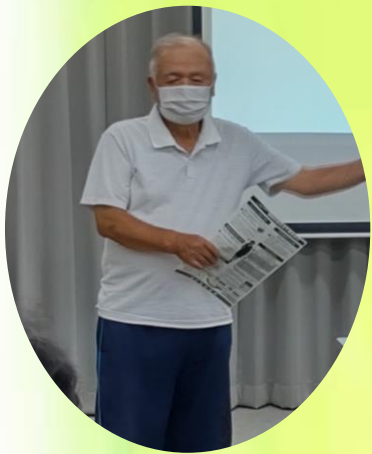
委員長よりご挨拶