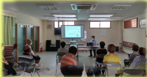
認知症サポーター 養成講座