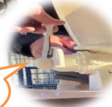
お餅がまるく 出てきま