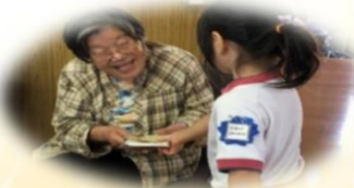
園児よりプレゼント ありがとう(*_**)

玉串老人憩いの家では、玉串自治会1～4が集まり、ふれあいの集いが開催されました。お食事を頂き、玉串保育園児の歌を聞き、お遊戯をみて楽しく過ごし、園児より手作りのお土産をもらって、皆さんいい表情をされていました。消費者センターより詐欺の寸劇。終わりにビンゴゲーム、なかなか開かなくてイライラの場面も。最後は景品を受け取り皆さん笑顔で終了となりました。